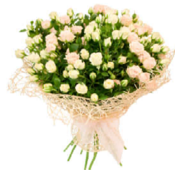
Дети, внуки, правнуки.

Мамуля родная! Сегодня твой день – Забудь все печали, невзгоды. Пусть будут не в тягость, А в радость тебе Твои наступившие годы! И пусть серебрится твоя голова Глаза же сияют от счастья! Все лучшие добрые в мире слова С любовью тебе посвящаются! Здоровья и крепости духа всегда, Терпения, сил, оптимизма! Поклон до земли от нас от детей! И долгой счастливой жизни!