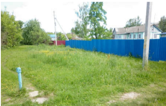
Ул. Центральная, 32.

Первое, куда мы приехали, улица Центральная. Въезд в районный центр. Говорят, гостя встречают по одежке, т.е. по внешнему виду. Так и хозяина – тоже. Что же видят въезжающие в поселок?