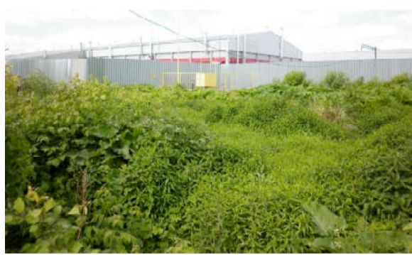
Ул. Моторная, у забора ООО «Вариант 1».

прятки. Заросли крапивы переходят в заросли борщевика. Если высота первой по пояс, то во втором взрослый человек спрячется легко, причем ему не надо будет даже приседать. Что любопытно. На этой же территории находится ГРП. Газовики за своим объектом следят. Проход к нему прокошен, терри-