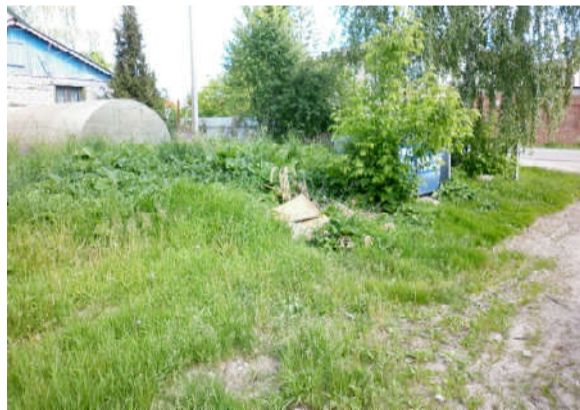
Во дворе дома 9 по ул. Центральная.

На улице Моторная находится ООО «Вариант 1». Общество занимается производством сыров. Это хорошо, когда у нас открываются новые производства. Но у забора можно смело играть в войну или в