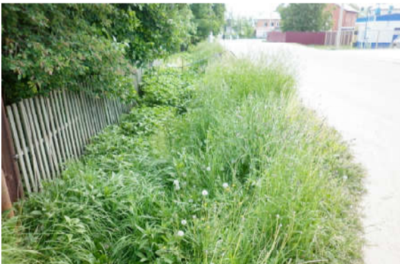
Угловой дом, ул. Кооперативная-Комсомольская.

Справа – в основном двухэтажные здания. Новые, после реконструкции, дворики, новые детские площадки, недавно высаженные туи, новый тротуар и порядок.